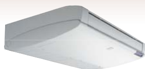
HRN – standardní verze s podokenní/podstropní jednotkou